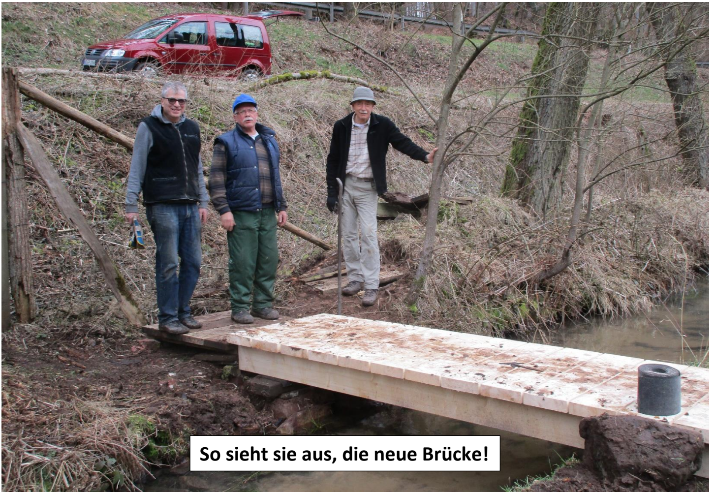
So sieht sie aus, die neue Brücke!