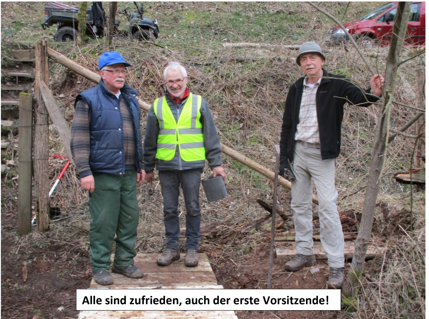
Alle sind zufrieden, auch der erste Vorsitzende!